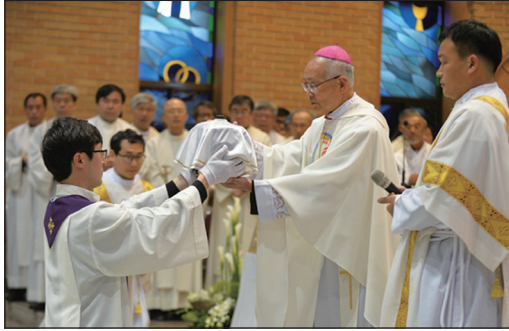
▲ 성목요일 성유축성미사(중앙성당/장덕영 기자)