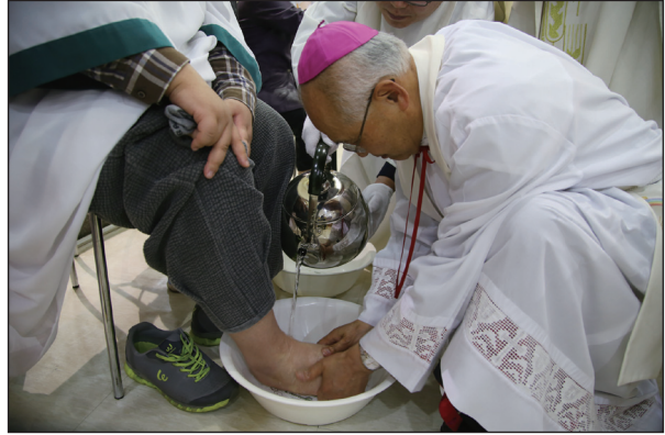
▲ 성목요일 주님만찬미사(문정성당)