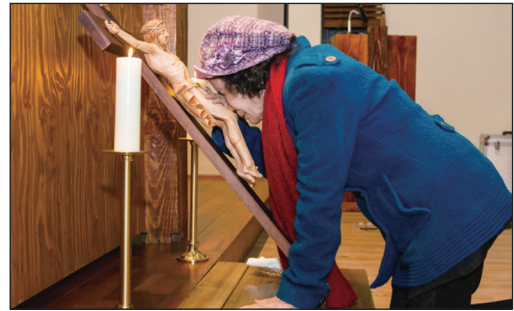
▲ 성금요일 이주민 주님수난예식 (중앙성당)