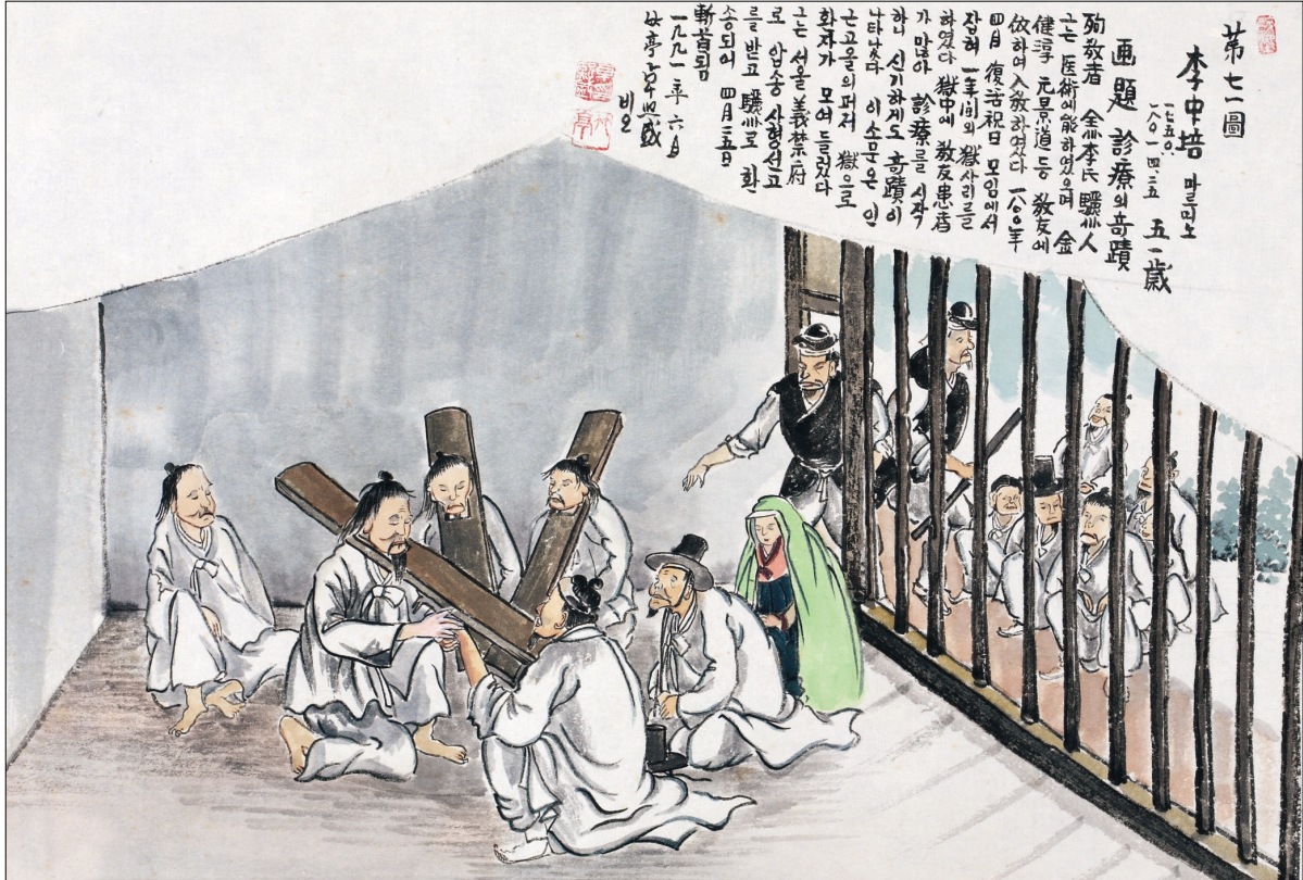
하느님의 종 124위 열전(25) - 이중배 마르티노(?-1801년)

발행인 | 이병호 편집 | 천주교 전주교구 홍보국 제2166호 http://jccatholic.or.kr E-mail | catholic114@hanmail.net 주소 | 560-110 전주시 완산구 기린대로 100번지 전화 | (063)230-1004 팩스 | (063)230-1175