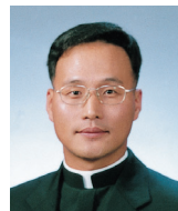
길성환 베드로 신부 (치명자산 성지)

그렇다. 올해 한 해를 살아갈 신앙인의 목표는 너무나도 명확하다. 우리 자신과 교회는 하느님의 개방성과 복음을 중심으로 내면의 풍요로움이 넘쳐 흐르고, 사회의 가장 힘없는 구성원들에게 관심을 갖는 모습이길 기도해 본다.