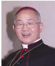
이병호 본천시오주교 전주교구장

1 교형자매 여러분! 2천년 대희년을 맞이하면서 우리는 <대희년 특별사목교서>를 발표한 바 있습니다. 그것은 제2차 바티칸 공의회 4대 헌장, 곧 [계시헌장], [전례헌장], [교회에 관한 교의헌장], [현대세계 사목헌장]의 기본 노선에 따라, 성서운동, 전례의 활성화, 소공동체 운동과, 주변 세계와의 관계를 개선하여 세상의 빛과 소금이 되기 위한 여러 과제, 곧, 선교, 생태환경, 생명, 사회복지, 북한돕기, 외국인, 장묘문화 개선 등을 활동목표로 설정한 것이었습니다. 그리고 2010년에는 지난 10년 동안 우리가 걸어온 길을 돌아보며, 잘되는 것은 더욱 발전시키고, 부족한 것은 보완하는 방향으로 노력할 것을 다짐하였습니다. 그런데 작년은 2천년 특별사목교서 이후 10년이 되는 해였기 때문에, 다시 한 번 <특별 사목교서>를 통해서 이 모든 것을 다짐하였습니다. 그리고 이 역시 우리 교회가 앞으로 오랜 동안 따르고 실천해야 할 제2차 바티칸 공의회 기본 정신을 계승하고 구현하는 것을 목표로 한 것이었습니다. 그러므로 금년에도 구체적 실천 사항에 관해서는, 2000년에 이어 작년 특별사목교서에서도 밝힌 내용 그대로입니다.