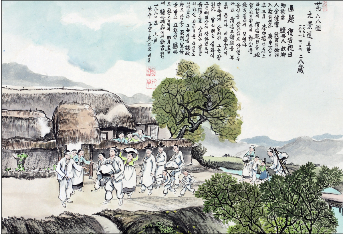
하느님의 종 124위 열전(26) - 원경도 요한(1774~1801년)

2014년도 교구장 사목교서 프란치스코 교황님과 함께 -기쁨의 물결을 온 세상에-