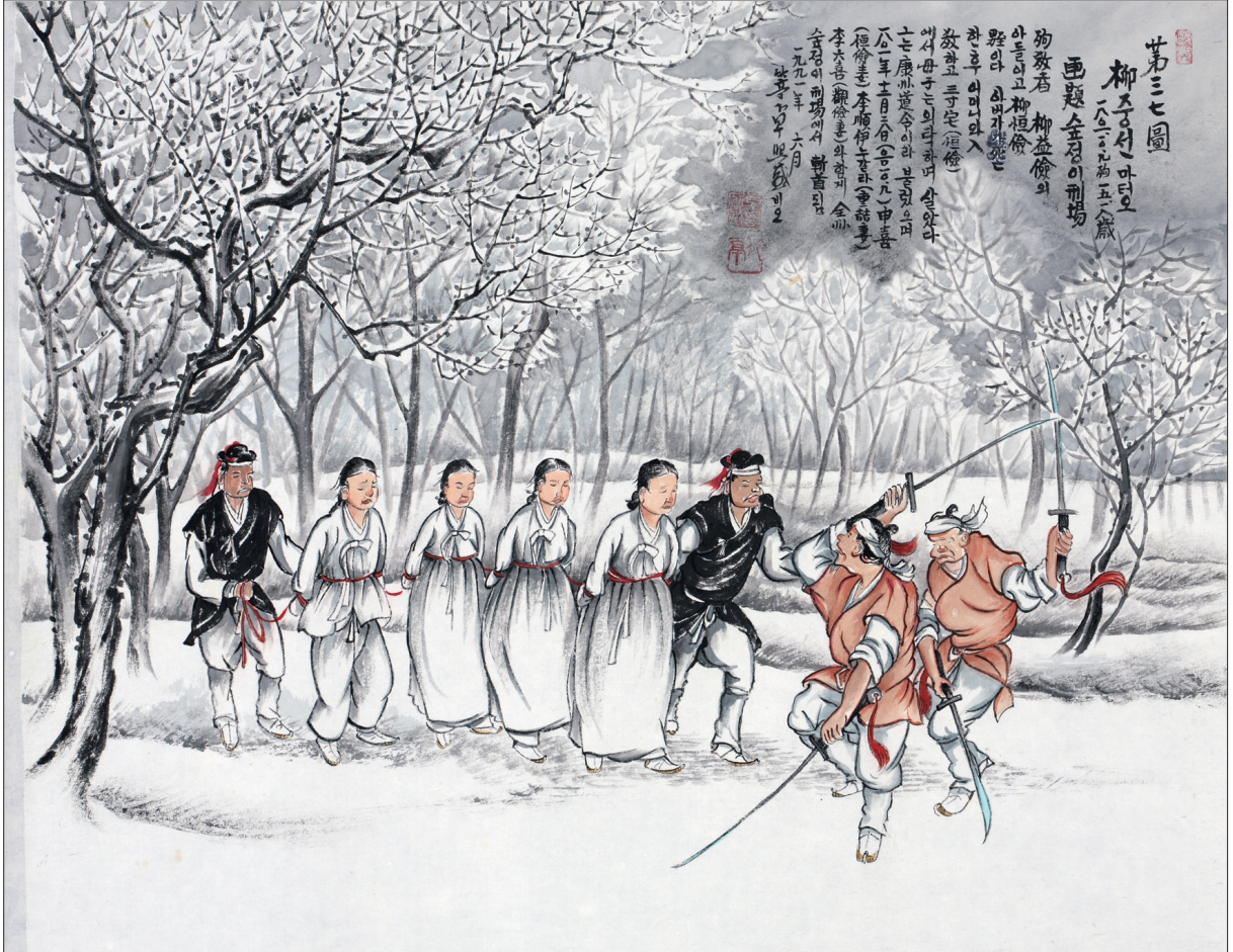
그림 | 탁희성 비오 · 글 | 김옥희 안나 수녀

발행인 | 이병호 편집 | 천주교 전주교구 홍보국 제 2076호 http://j catholic.or.kr E-mail | catholic114@hanmail.net 주소 | 560-110 전주시 완산구 기린대로 100번지 전화 | (063)230-1004 팩스 | (063)230-1175