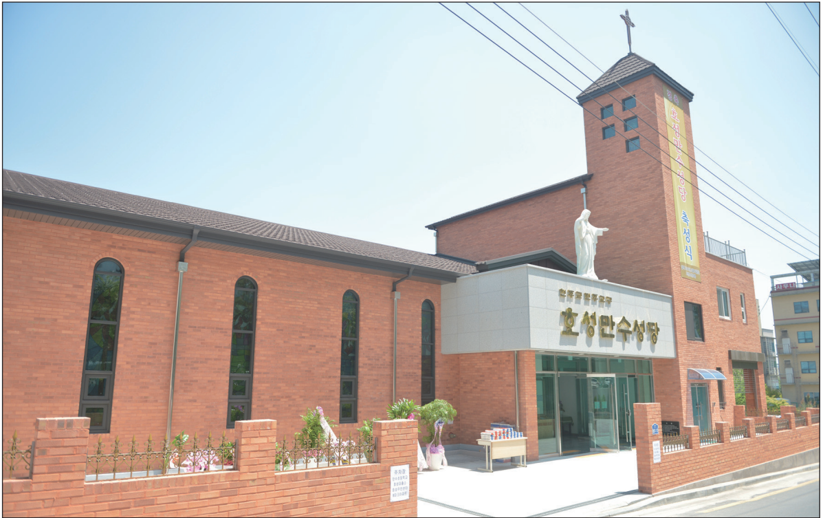
호성만수 성당 축성을 축하드립니다(2015. 5. 16)

2015년 교구장 사목교서 - 너희의 이름이 하늘에 기록된 것을 기뻐하여라