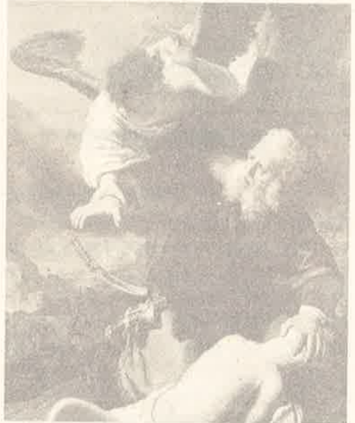
이삭을 바치는 아브라함

하나님은 아들 대신 덩불에 걸린 수양을 희생제물로 선정하신다. 그리하여 아브라함은 외아들을 죽이지 않고도 하나님께 찬미의 제사를 바칠 수 있게 되었고, 하나님 편에선 아브라함에게 하신, 후손을 많게 해주시겠다는 약속의 첫열매 이삭을 희생시키지 않고서도 정성된 번제의 제사를 받아들일 수 있게 되었다. 아브라