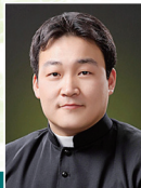
사철완 세례자 요한 (서신동 성당)