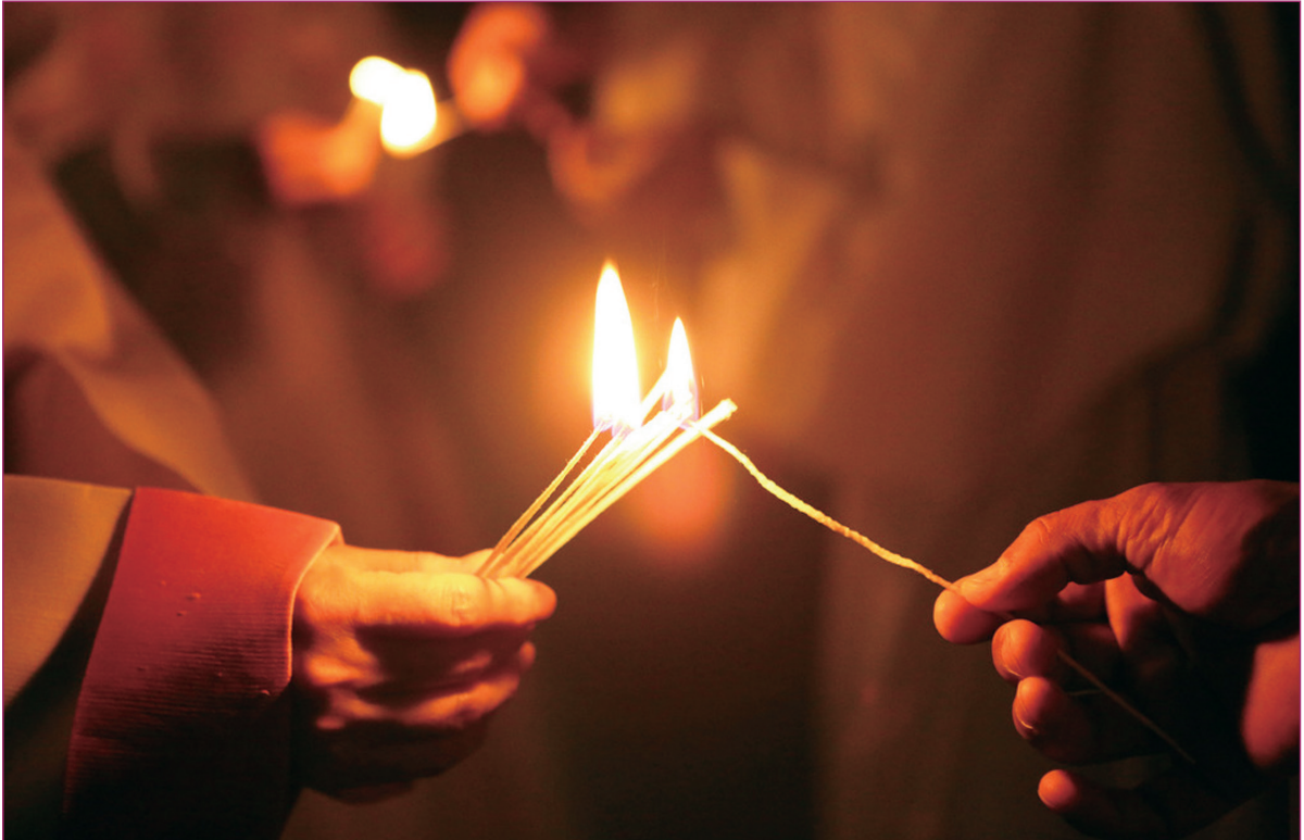
배중호 마리아 作(전주교구 가톨릭사진가회)

2015년 교구장 사목교서 - 너희의 이름이 하늘에 기록된 것을 기뻐하여라