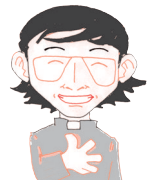
윤 클레멘트 신부

그는 믿음과 진리를 위하여 잡힌 몸이 된 후, 매를 맞고 많은 고난과 고초를 받았음에도 불구하고 강하고 굳센 믿음을 보여주었다. 다음은 그를 통하여 드리는 기도문이다. “전능하신 하느님 우리의 기도를 들어주소서. 성 블라시오의 전구를 통하여 우리의 모든 목병과 다른 여러 질병들로부터 우리를 구하소서”