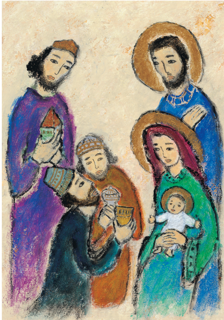
그림 : 김옥순 막달레나 수녀(성바오로딸수도회)

발행인 | 이병호 편집 | 천주교 전주교구 홍보국 제 2004호 http://j catholic.or.kr E-mail | catholic114@hanmail.net 주소 | 560-110 전주시 완산구 남노송동 78-3 전화 | (063)230-1004 팩스 | (063)283-9365