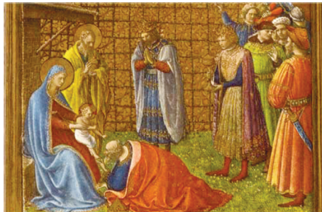
프라안젤리코, 동방박사들의 경배

-성경에서는 자주 “예수 그리스도는 어떠한 분이신가?” 제시되어 있다. 요한 복음 사가는 그분은 하느님의 말씀이었고 하느님이셨다. 그리고 하느님과 함께 계셨다. 그분을 통하여 생명이 생겨났고, 그 생명은 사람들의 빛이었다. 말씀이 사람이 되어 우리 가운데 사셨다. 아무도 하느님을 본 적이 없다. 하느님 아버지와 가장 가까우신 분이 하느님 아버지를 알려 주었다.