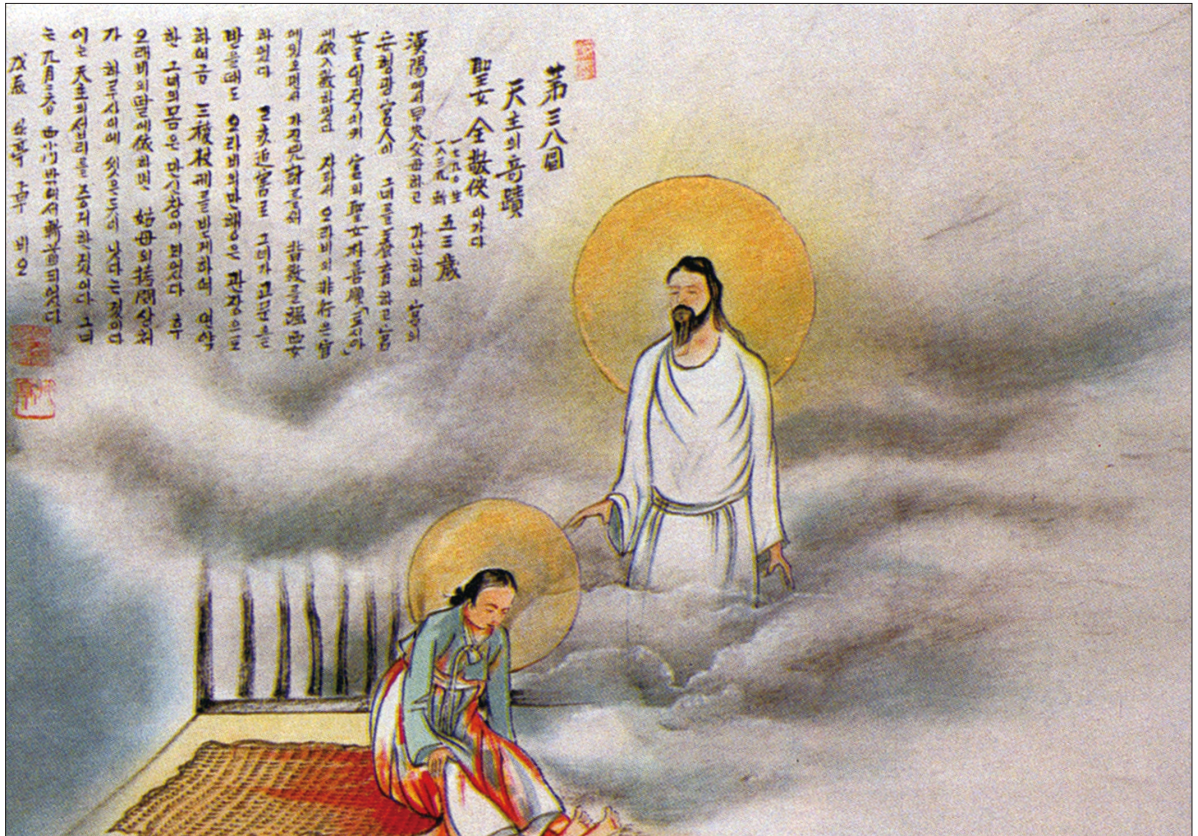
그림 | 탁희성 비오 · 글 | 김옥희 안나 수녀

천주의 기적 / 전경협 성녀는 옥에서 모진 고문으로 연약한 몸이 만신창이 되었는데 기적적으로 하루 아침에 씻은 듯이 다 나왔다.