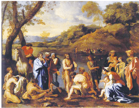
사람들에게 세례를 베푸는 세례자 요한 (poussin 1635년 작)

오늘 복음은 세례자 요한에 관한 이야기이다. 예수님의 친척인 요한은 예수님에 앞서서 활동한 구약의 마지막 예언자이면서 구약과 신약을 이어 주는 예언자이기도 하다. 요한 예언자는 사막에서 살면서 낙타 털옷을 입고 메뚜기와 들꿀을 먹으면서 살았다고 성경은 전한다. 그러면서 사람들에게 요르단 강에서 죄의 용서를 위한 회개의 세례를 주었으며, 나보다 더 큰 능력을 지니신 분이 내 뒤에 오시는데 나는 그분의 신발 끈을 풀어드릴 만한 자격조차 없는 비천한 사람이라고 하면서 예수님의 앞길을 미리 준비한 분이시다.