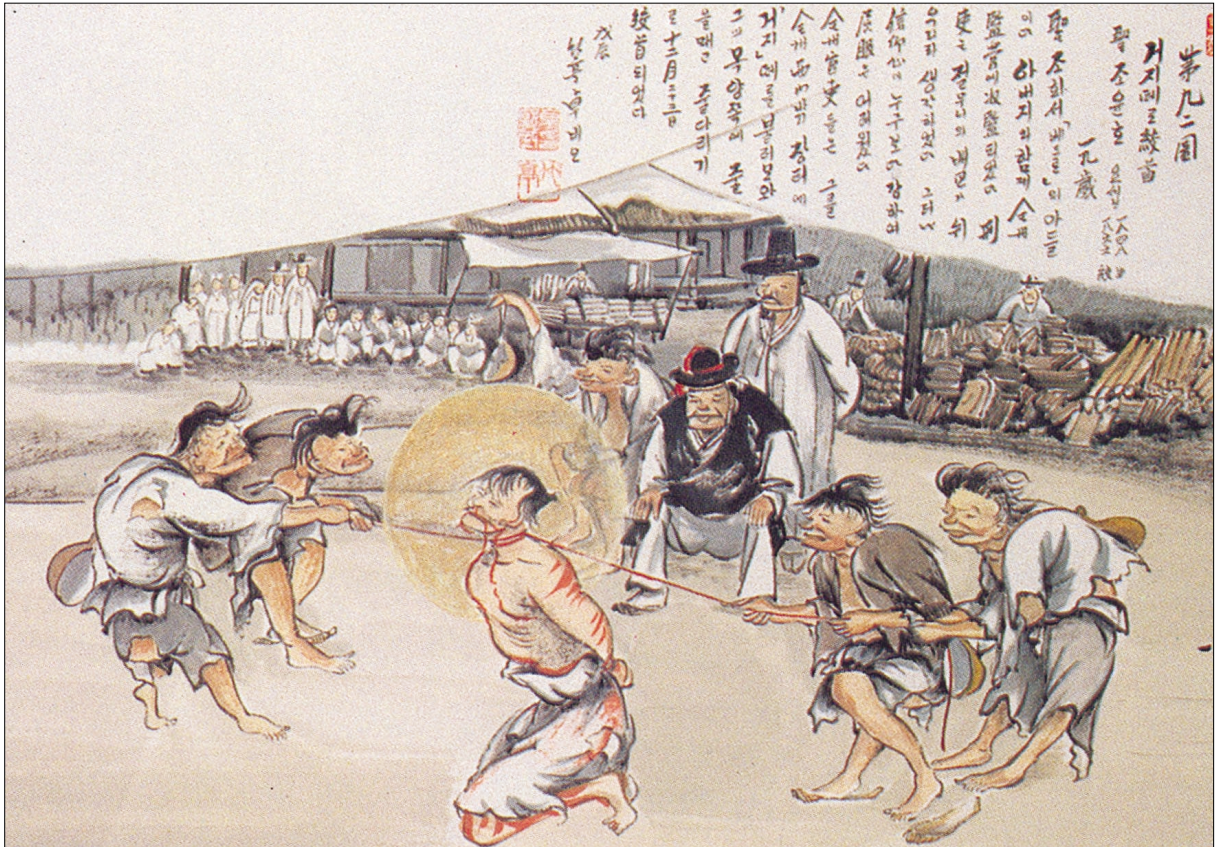
그림 | 탁희성 비오작

발행인 | 이병호 편집 | 전주교 전주교구 홍보국 제 2064호 http://j catholic.or.kr E-mail | catholic114@hanmail.net 주소 | 560-110 전주시 완산구 기린대로 100번지 전화 | (063)230-1004 팩스 | (063)230-1175