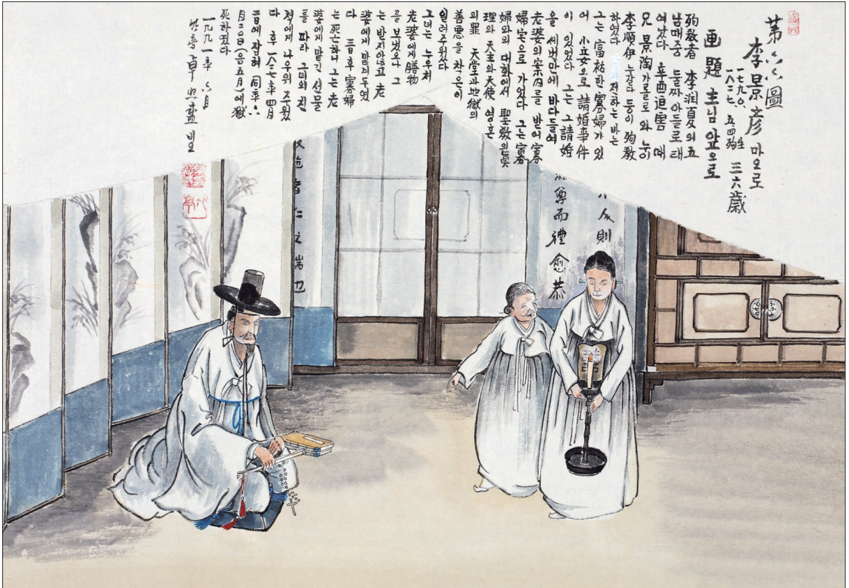
그림 | 탁희성 비오 · 글 | 김옥희 안나 수녀

발행인 | 이병호 편집 | 전주교 전주교구 홍보국 제 2078호 http://jcaatholic.or.kr E-mail | catholic14@hanmail.net 주소 | 560-110 전주시 완산구 기린대로 100번지 전화 | (063)230-1004 팩스 | (063)230-1175