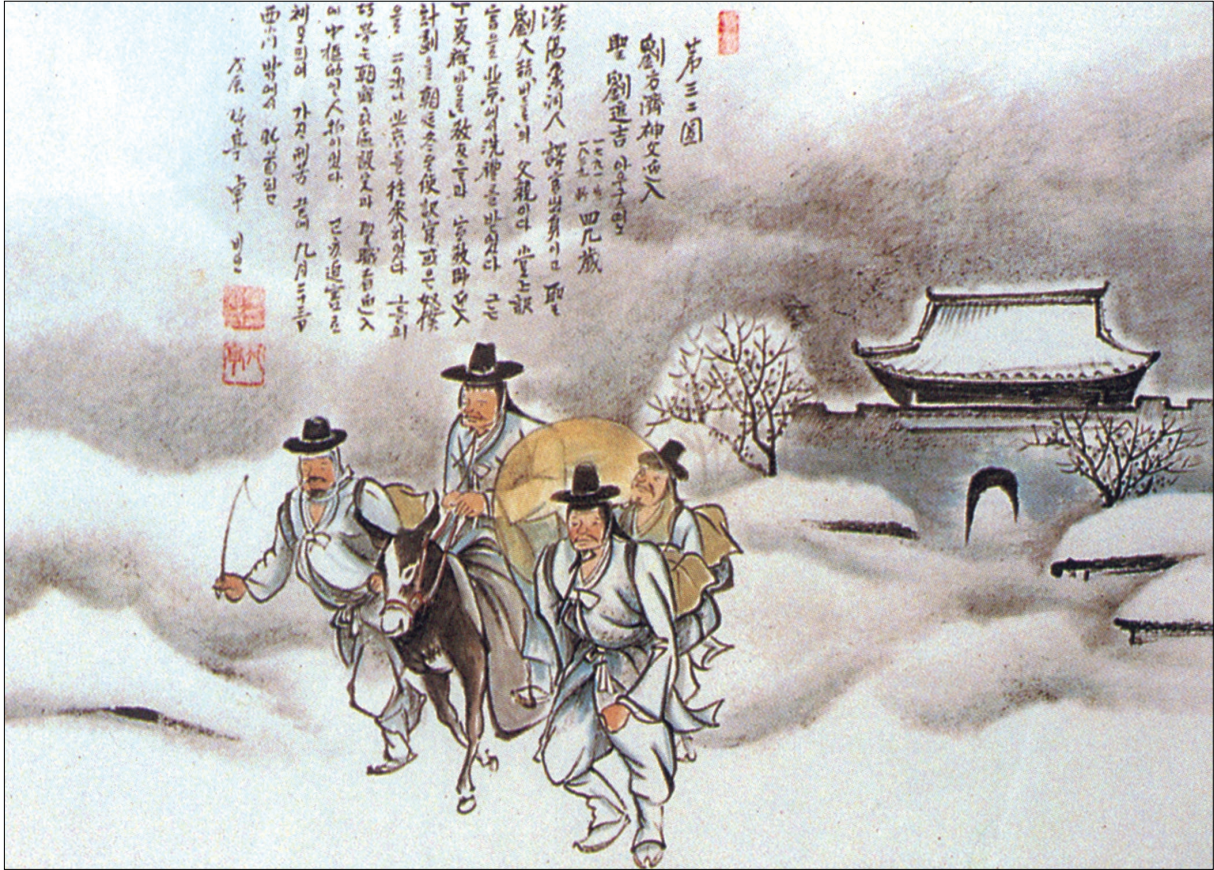
그림 | 탁희성 비오 · 글 | 김옥희 안나 수녀

발행인 | 이병호 편집 | 전주교 전주교구 홍보국 제 2097호 http://jcatholic.or.kr E-mail | catholic114@hanmail.net 주소 | 560-110 전주시 완산구 기린대로 100번지 전화 | (063)230-1004 팩스 | (063)230-1175