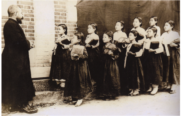
선교사와 여학생들(1911년 경) 교육사업은 선교의 중요한 수단이었다. 특히 여성교육의 중요성을 절감한 선교사들이 여자학교를 세워 여학생들을 계몽시켰다.

지금까지 살펴본 내용을 중심으로 정리하자면, 일제강점기의 천주교와 개신교는 한국에 도입된 초기부터 정치·사회적인 배경을 바탕으로 각기 다른 선교전략을 형성하였다고 말할 수 있다. 천주교는 박해시대에는 산지 중심이었다가 종교자유 이후 평지