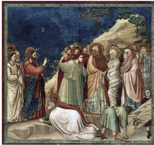
나자로를 살리심 (지오토 작)

주님께서는 에제키엘에게 환시 속에서 사람 뼈들로 가득 찬 골짜기를 보여주시며 말씀하셨습니다. “에제키엘, 어떻게 생각하느냐? 이 마른 뼈들이 생명으로 다시 되돌아올 수 있겠느냐?” 그 예언자는 조심스럽게 대답했다. “주 야훼님, 당신께서 그것을 가장 잘 아십니다”(에제 37,3). 뼈 하나하나가 그것의 다른 반쪽을 찾듯이, 뼈들과 뼈들이 털거덕털거덕 소리를 내었다. 그 뼈들은 근육들에 의해 서로 한 덩어리가 되었다. 살은 그것들을 에워싸고 붙어나기 시작했다. 그러더니 살가죽이 살을 덮었다. 그리고 마지막으로 주님께서는 그 몸들 위에 숨을 불어넣고 그들은 생명으로 되돌아왔다!