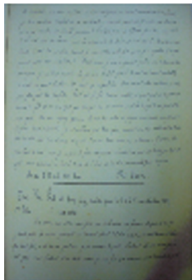
- 성 다블뤼 주교의 이경언 바오로의 편지 - (조선 주요 순교자 약전)

사형선고를 받았지만, 전라감사는 형을 집행하지 않았다. 이경언 바오로는 순교의 날을 손꼽아 기다렸지만 그의 육체는 더 이상 고통을 이겨 내지 못하였다. 1827년 6월 27일(음력 윤 5월 4일) 전주 옥중에서 하느님께 영혼을 받쳤으니, 이때 그의 나이 35세였다.