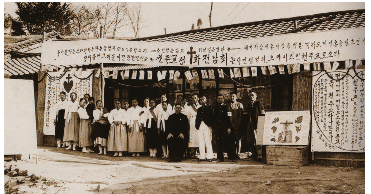
성화전람회(1937년) 천주교에 대해 잘 모르던 사람을 대상으로 성화를 전시하여 관심을 끌고 가톨릭의 진리를 알리며 선교할 목적으로 성화전람회를 열었다.

의 도시 중심으로 선교전략이 바뀌었다면, 개신교는 도시 중심에서 점차 중소도시와 그 주변의 농촌지역을 대상으로 선교를 하였다. 또한 천주교는 전국적 규모에서 서울을 중심으로 계층적인 교구를 나누면서 안정적인 발전을 추구하였다면, 개신교는 각 교파별로 선교지역을 나누면서 지역주의의 갈등이 나타나기도 하였다. 그렇지만 이 시기에 천주교와 개신교 모두 도시를 선교거점으로 삼기 시작하면서 각자의 종교적 영향력을 확대해나갔다는 데 공통점을 찾을 수 있다.