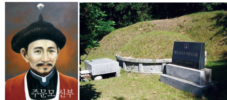
수원 어능성지내에 있는 주문모 야고보 신부 가묘 ▲

최인길에게 세례성사를 주다 조선에 입국한 첫 성직자인 주문모 야고보 신부가 최인길 마티아에게 세례를 주고 있다.