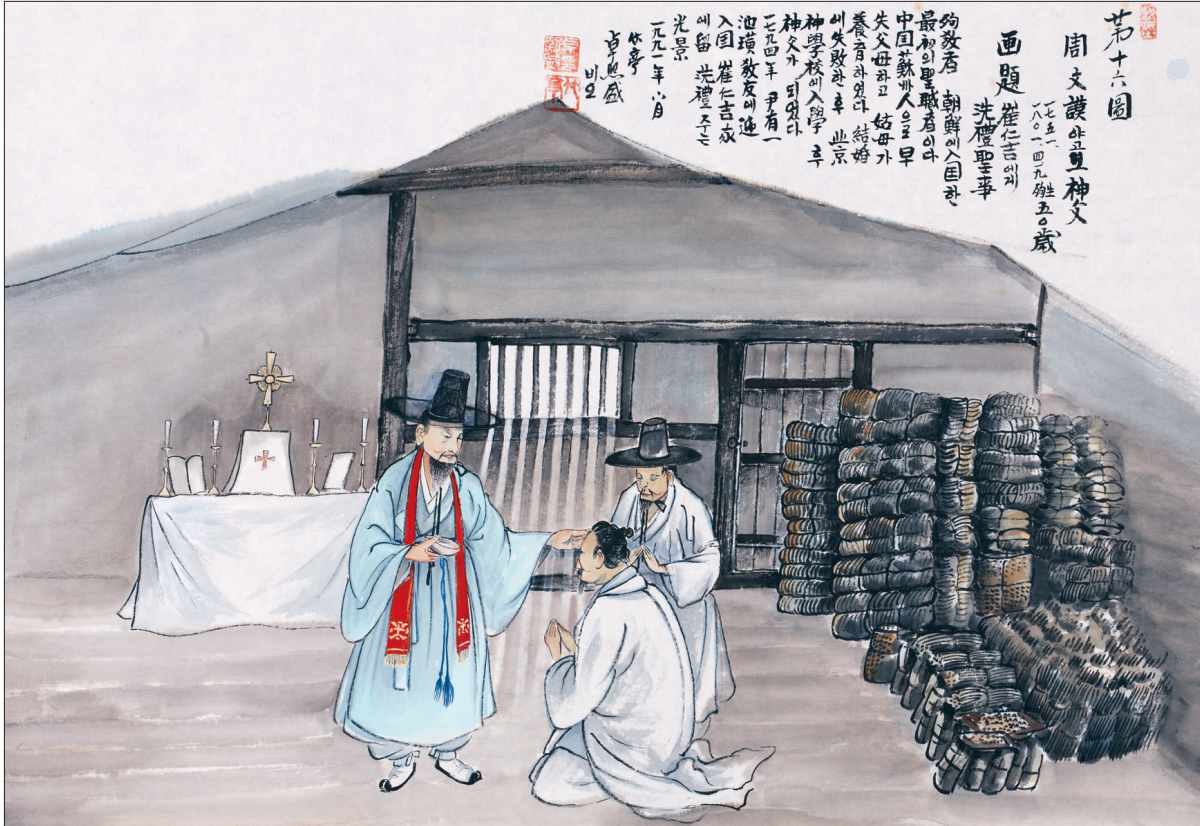
하느님의 종 124위 열전(2) - 주문모 야고보 신부(1752-1801)