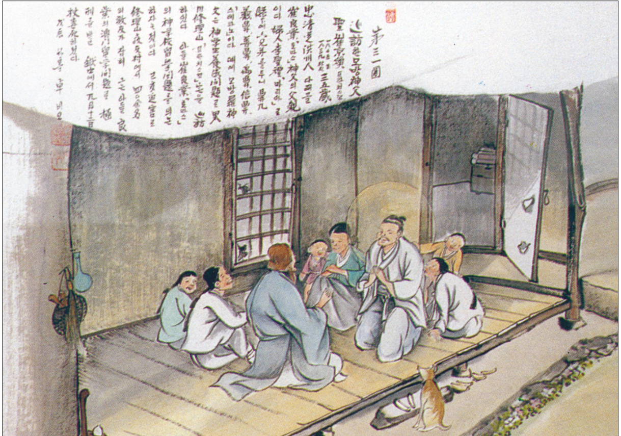
그림 | 탁희성 비오 · 글 | 김옥희 만나 수녀