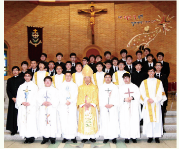
2013년 사제 서품

만물이 새 기운을 받아 꿈틀거리는 새 봄에 쌍백합을 통해 영적 기운을 충전하시기를 바랍니다.