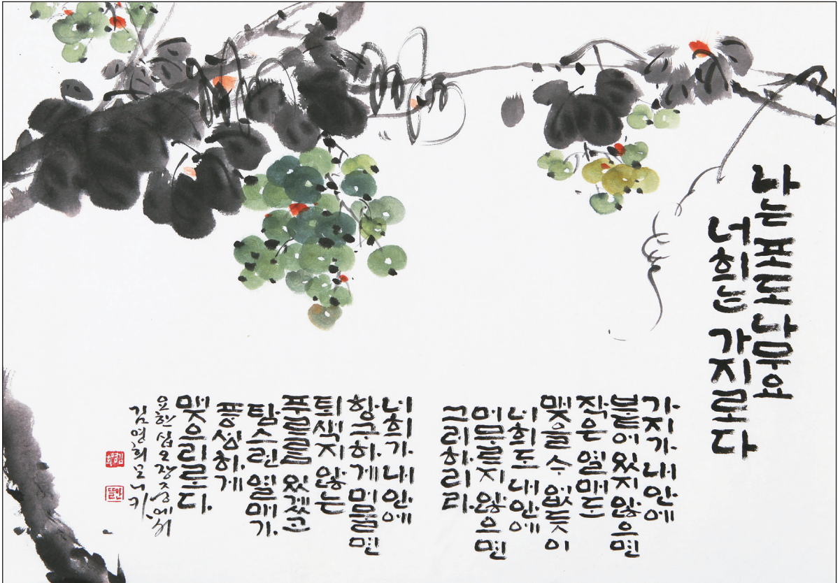
김영희 모니카作(전주가톨릭미술가회·호성만수 성당)

제 1 독 서 사도 9,26-31 화 답 송 시편 22(21),26나-27.28과 30나-30다-32(◎ 26나 참조) ◎ 주님, 저는 큰 모임에서 당신을 찬양하나이다. (또는 ◎ 알렐루야.) 제 2 독 서 1요한 3,18-24 복음환호송 요한 15,4,5 참조 ◎ 알렐루야. ○ 주님이 말씀하십니다. 내 안에 머물러라. 내 안에 머무르고 나도 그 안에 머무르는 사람은 많은 열매를 맺으리라. ◎ 알렐루야. 복 음 요한 15,1-8 영 성 체 송 요한 15,1,5 참조 주님이 말씀하십니다. 나는 참포도나무요 너희는 가지다. 내 안에 머무르고 나도 그 안에 머무르는 사람은 많은 열매를 맺으리라. 알렐루야.