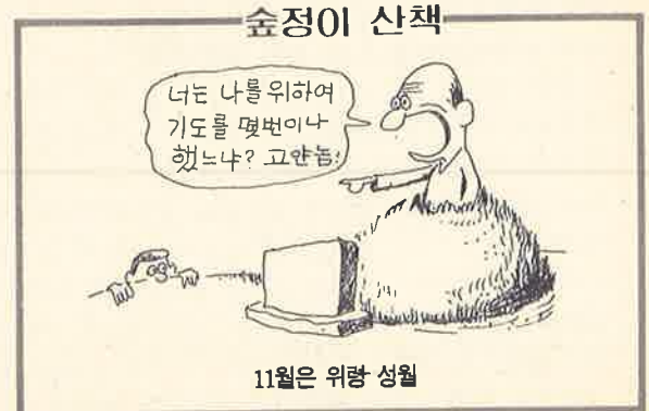
11월은 위령 성월