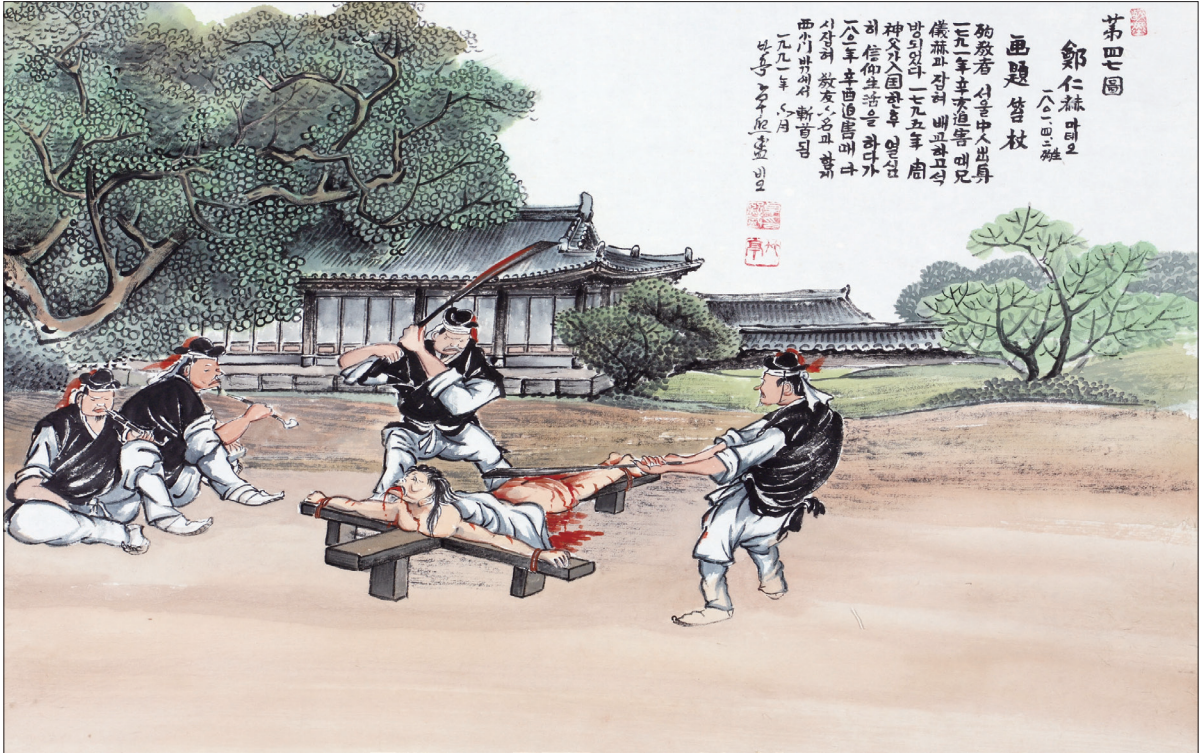
하느님의 종 124위 열전(31) - 정인혁 타대오(?~1801년)