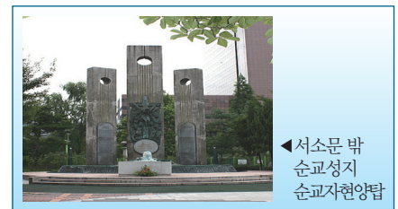
◀ 서소문 밖 순교성지 순교자현양탑

관장 / 정인혁 타대오는 혹독한 형벌에도 끝까지 신앙을 고백하며 교회에 해가 되는 말은 입 밖에 내지 않았다.