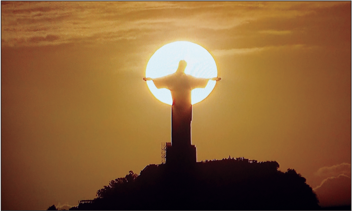
오성기 크리스토모 신부(관리국장)