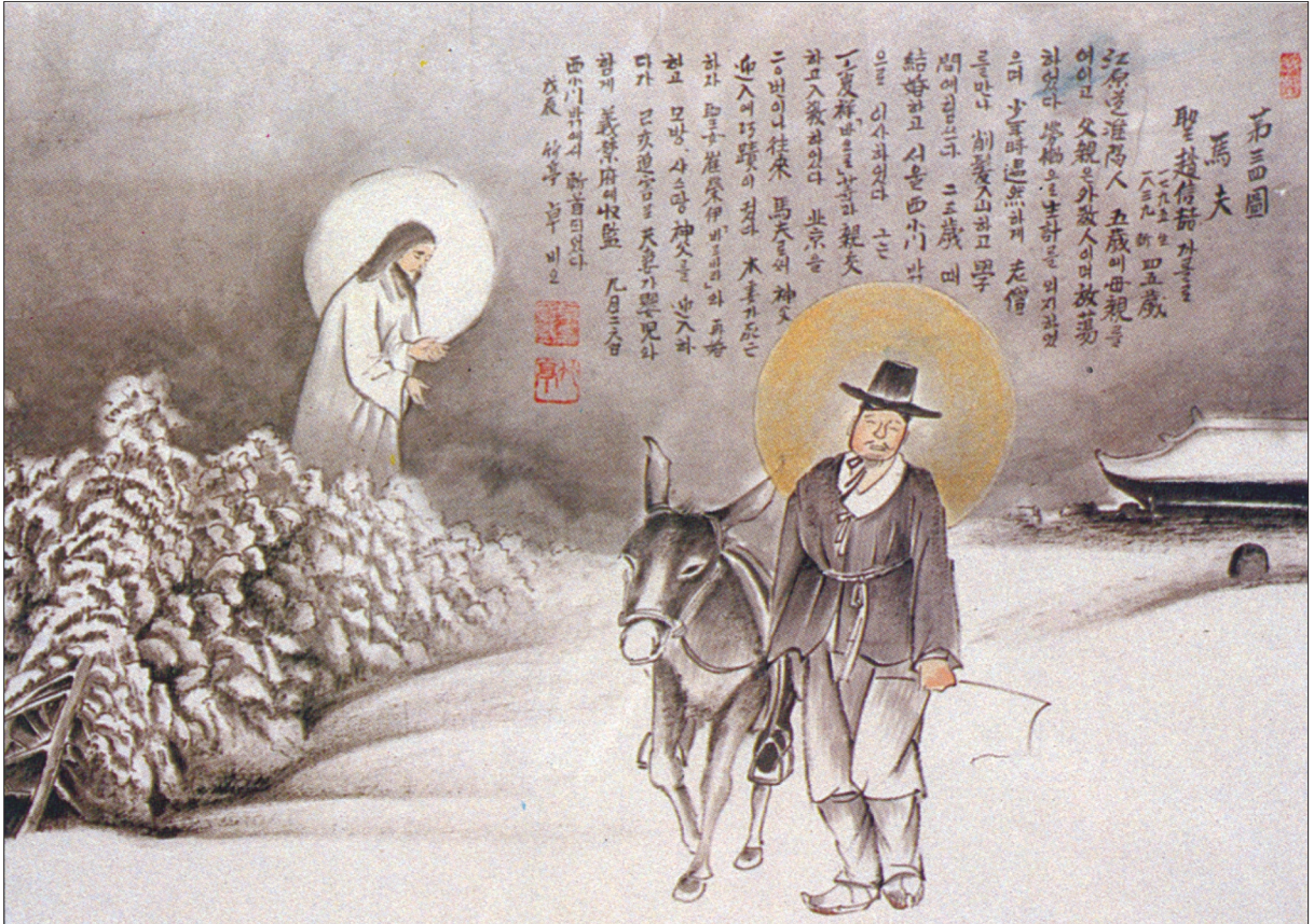
그림 | 탁희성 비오·글 | 김옥희 안나 수녀

마부 / 조신철 성인은 신부 영입을 위하여 북경에 마부로 여러 차례 왕래하였다.